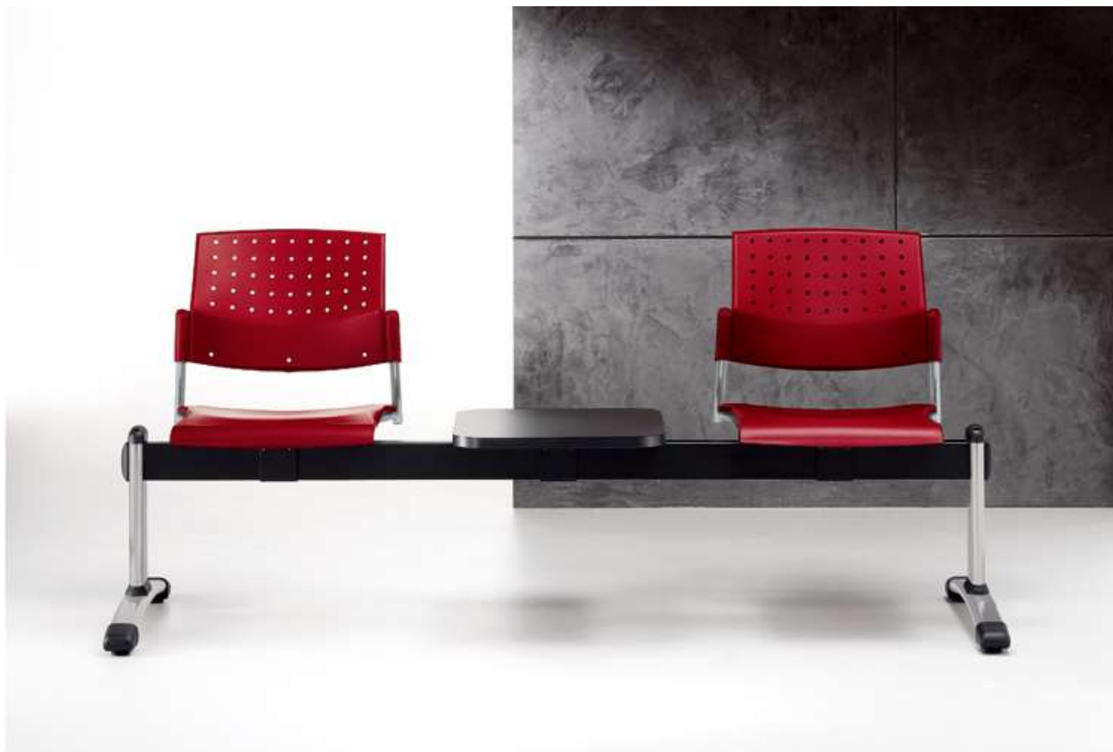
POUTRE 2 A 5 PLACES dossier plastique Référence selon modèle