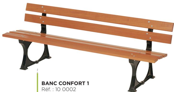
BANC CONFORT 1 Réf. : 10 0002