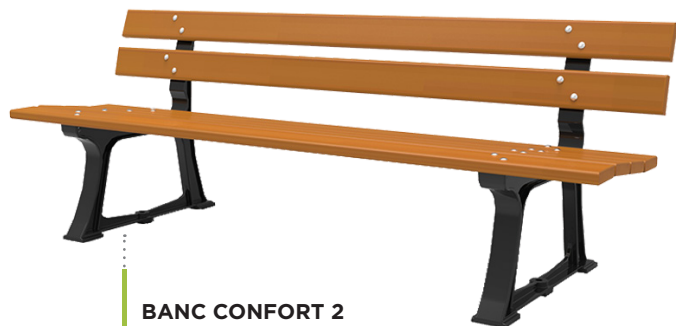
BANC CONFORT 2 Réf. : 10 0003