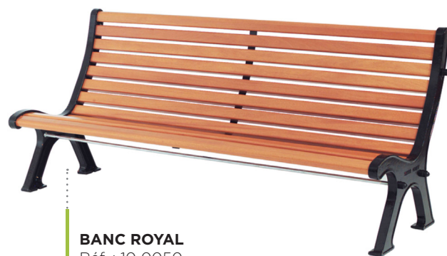
BANC ROYAL Réf. : 10 0050