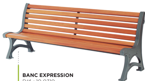
BANC EXPRESSION Réf. : 10 0310

Couleurs à choisir parmi les nuances RAL, sablées ou autres textures de la gamme Futura d'AkzoNobel.