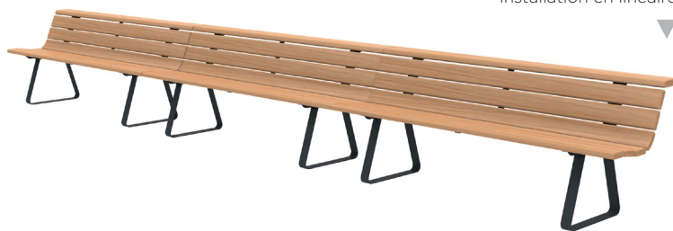
installation en linéaire